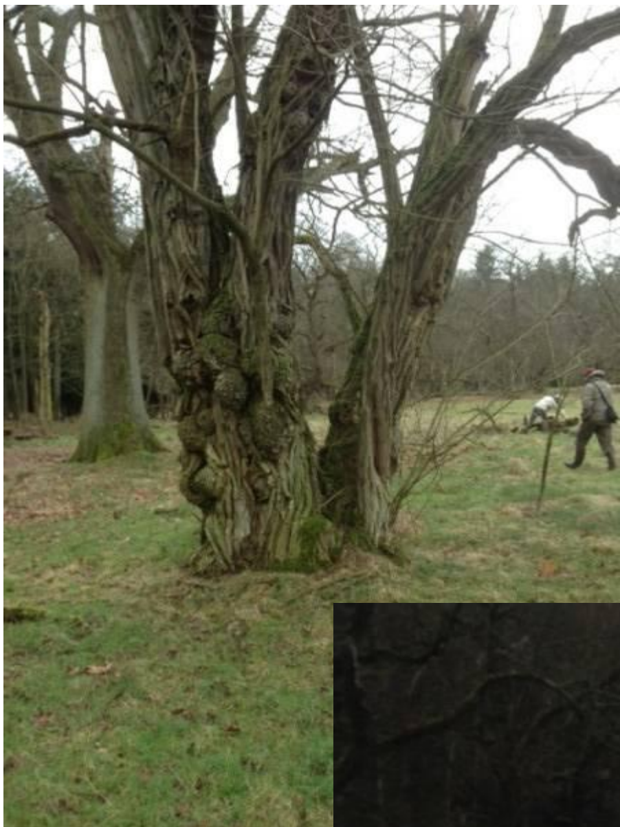
Een van de knoestige oude kastanjes waar we vorig jaar de franse aardkastanje vonden.