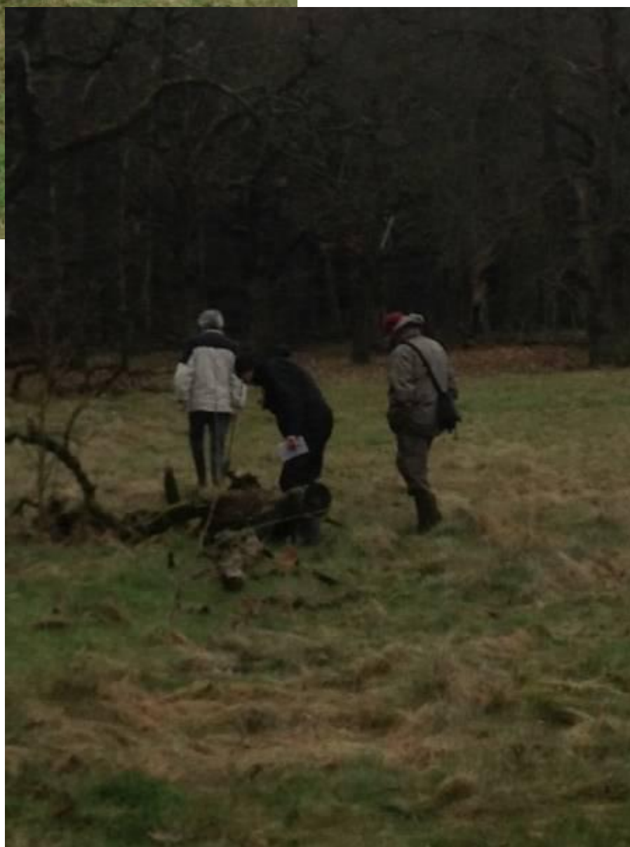
en wat knoestige slobkousjes